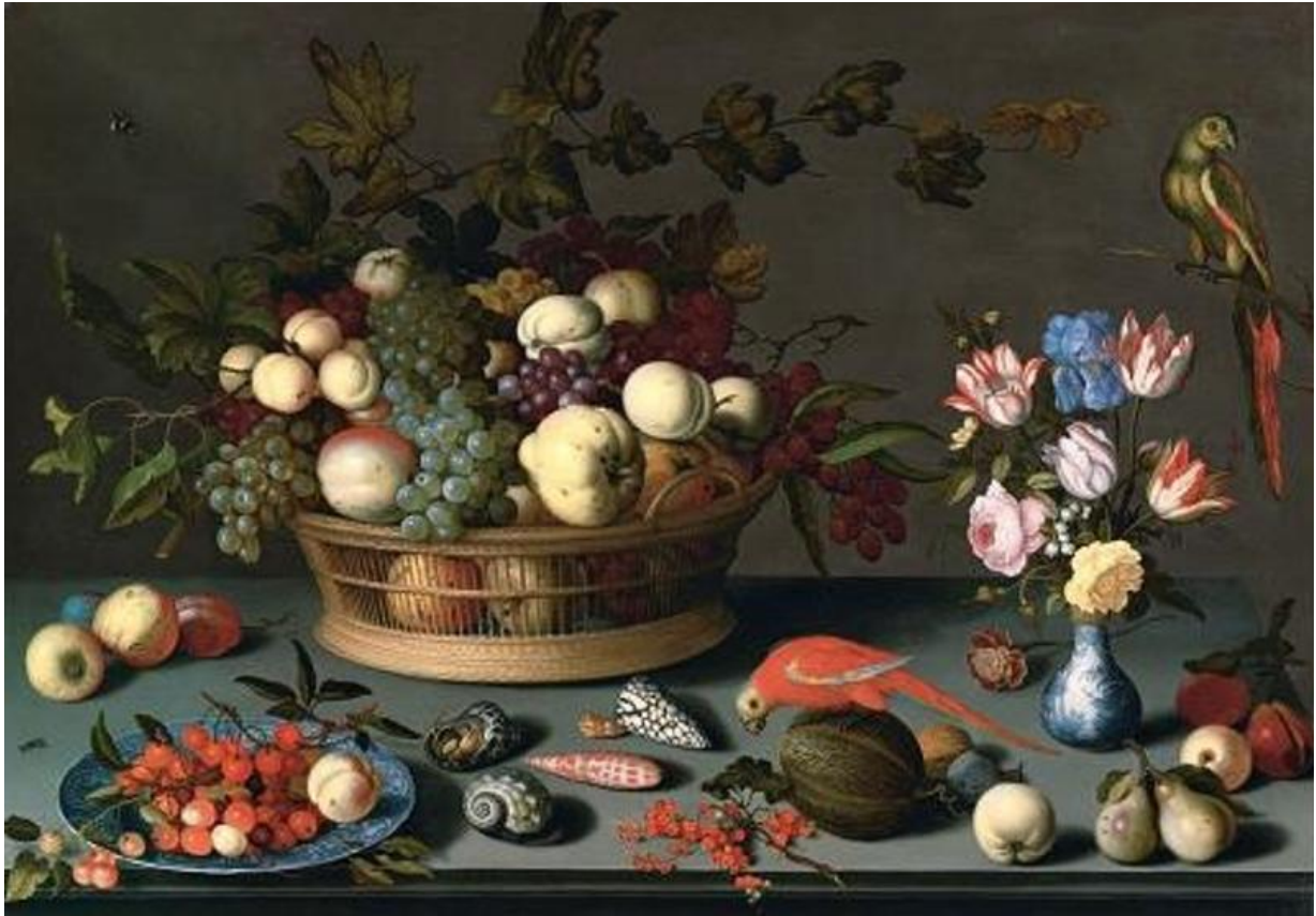
BALTHASAR van der AST (Middelburg before 1590 - after 1656 Delft)

"A Still Life on a table with grapes and other fruits in a basket, cherries on a Delft plate, tulips, irises and other flowers in a Wan-li vase, a group of shells, a parrot perched on a Melon and another perched on a branch" on panel: 75 x 107 cm; signed on the slab 'B.vander. ast'(l.m.)