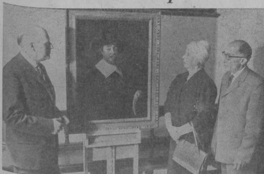
(Van onze verslaggever)

Russisch echtpaar kocht overschilderd mansportret