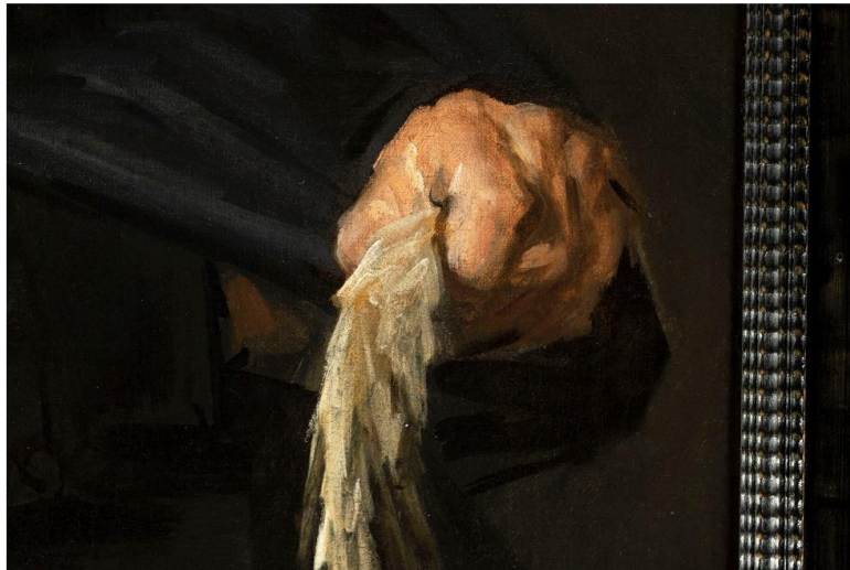
(Illustration 3: detail of the hand )