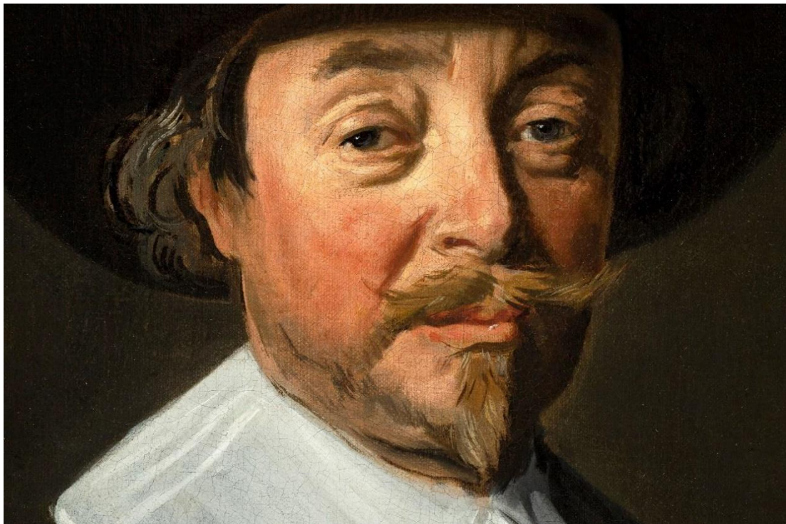
(illustration 4: detail of painting)

The face also shows that Frans Hals is at the height of his talents and skill. The individual character of the person portrayed is expressed in a phenomenal way. As is so often the case in his portraits, Hals 'mercilessly' illustrates the essence and unique character of his client: in this case, for example, we see the realistic and honest expression of a distinguished Haarlem citizen.