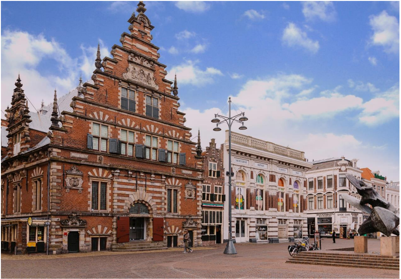
The Frans Hals Museum in Haarlem

A revaluation of Frans Hals was fuelled by the opening of the Haarlems Gemeentemuseum in 1862: the museum that would later be renamed the 'Frans Hals Museum'. His most important group portraits, already mentioned above, became visible to a large audience for the first time from that moment on.