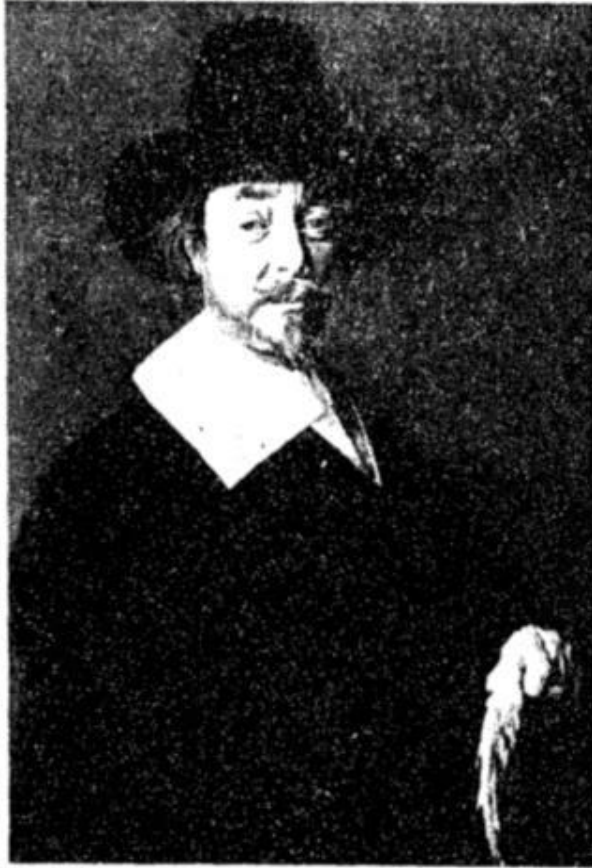
Portrait by Frans Hals the Elder that has soared in value